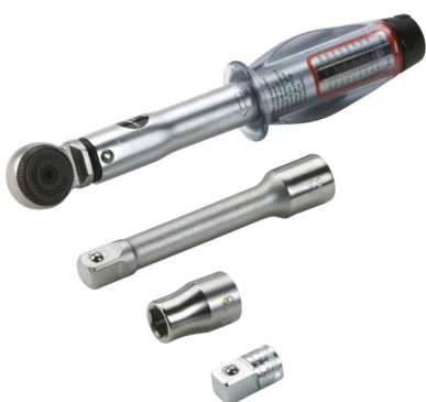
Gereedschapset voor KES-M