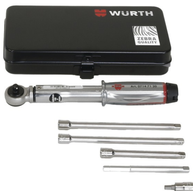
Gereedschapset voor HSI 150-DG/HRK SSG