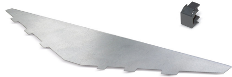
Afdekking bovenaan voor patchpaneel KS 24x-a, gehoekt Blindafdekking, zwart